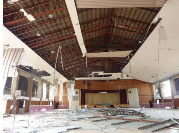
写真 5.7-2 在来工法による天井の脱落被害