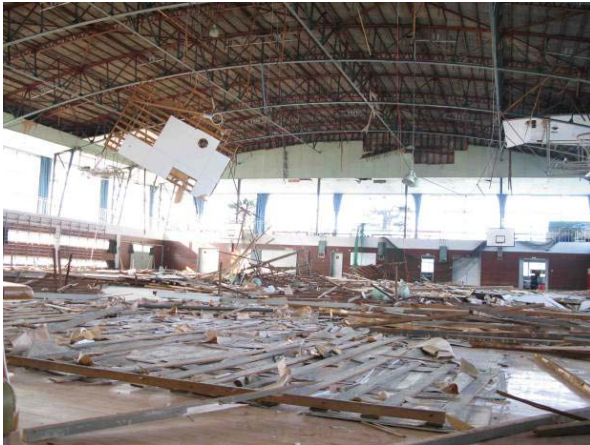
写真 5.7-1 木下地天井の脱落被害

木下地天井3件の被害は、天井板・下地ともに全面的に脱落したものが1件（写真5.7-1）、天井の端部で損傷したものが2件である。5.3で構造骨組に関する被災度区分が判定V s と判定されたものが2棟あるが、その内の1件が写真5.7-1の事例であり、ギャラリーにある張間方向のラチス柱14本の内6本で柱を構成する斜材の座屈が確認されるなど、構造体に大きな損傷を生じている。構造骨組が被災度区分でV s と判定されたもう一方の事例は、桁行ブレースについて交差部および端部でのボルト破断、ブレースの座屈などが見られたものの、天井端部が破損する程度に留まっている。