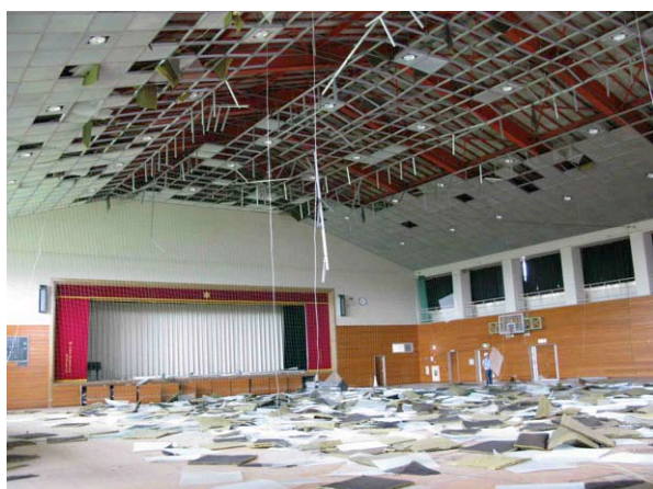
写真 5.7-3 天井板・下地材が脱落した被害