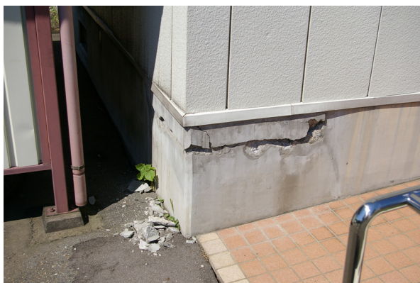
写真-5.6 柱脚部コンクリートの割れ・剥落 (長岡市)