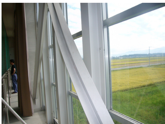
写真-5.5 筋かい材の座屈 (刈羽村)

筋かい材の座屈や、柱脚部コンクリートのひび割れ・剥落等が見られた鉄骨造建築物があった。