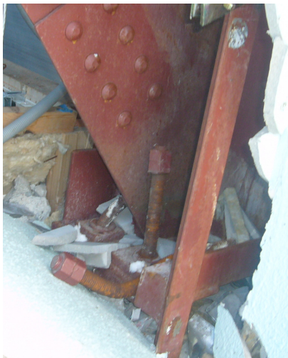
写真-5.3 アンカーボルトの引き抜け