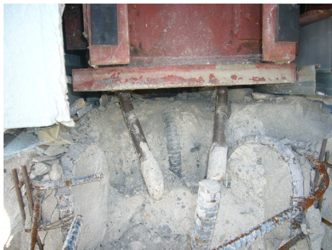
写真-5.4 鉄骨柱脚部コンクリート破壊