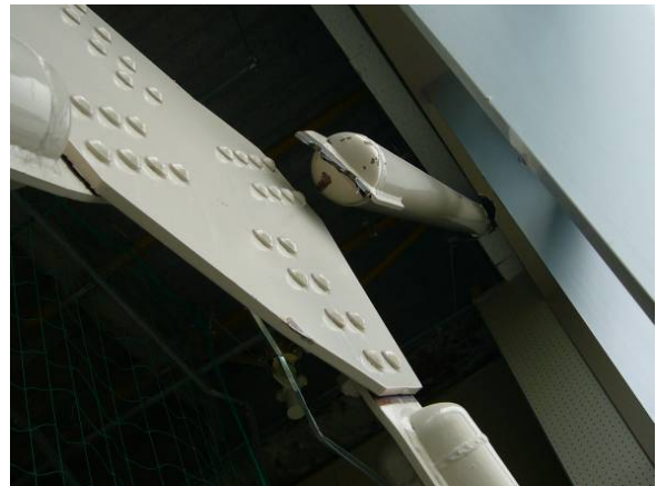
写真-5.2 筋かい材割り込みプレート破断