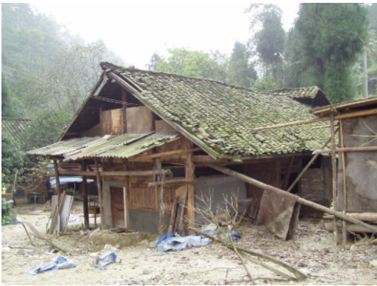
写真 4.2.7.3 木造の住宅 (No4) 相当傾いているものの倒壊は免れている