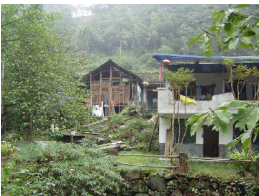
写真 4.2.7.5 木造 (左 No8) とレンガ造 (右 No9) が並存する敷地。木造は、農 作物が収納されており継続使用されて いる