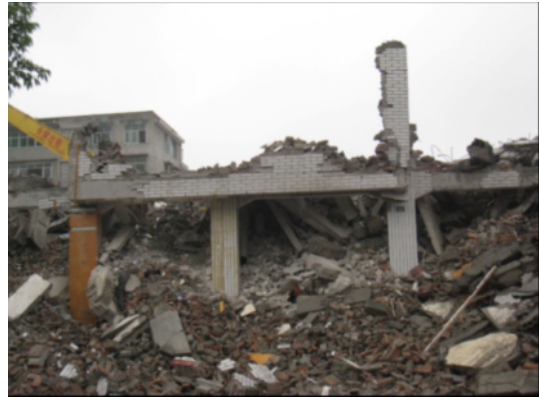
写真 4.2.2.12 解体途中の隣接建物(解体が進んでいることから、2階以上は、写真 4.2.2.11 より被害が大きかったと推測される。)