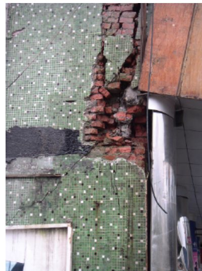
写真 4.2.3.16 (店舗兼住宅 6) 2階の壁端脚部の破壊