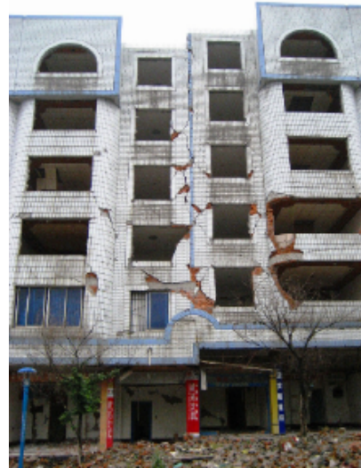
写真 4.2.3.8 (金融ビル) 2階以上の組積壁せん断破壊 (正面)