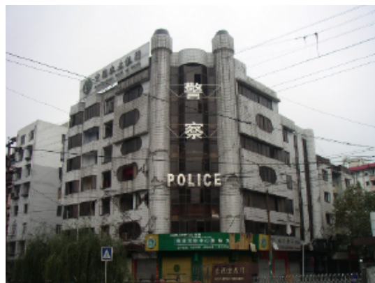
写真 4.2.3.12 (警察署) 被害状況全景

その他の被害状況として、写真 4.2.3.13~4.2.3.14 のように基礎部からの脱落により建物の崩壊に至ったものも見られたが、これは枠組組積造における 1 階部分の