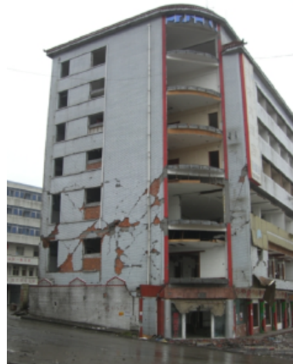
写真 4.2.3.4 (店舗兼住宅2) 2階以上の組積壁のせん断破壊