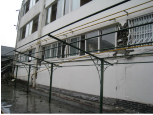
写真 4.2.2.7 隣接する同様の共同住宅