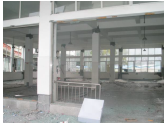
写真 4.2.1.3 写真 4.2.1.2 の内部（柱の柱頭柱脚が曲げ破壊し、主筋の座屈も若干見られた。）