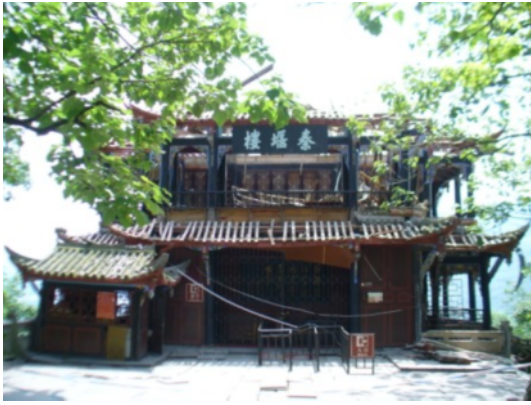
写真 4.2.2.18 歴史的建築物(屋根瓦の脱落)