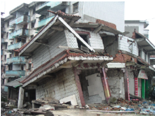
写真 4.2.3.13 (店舗兼住宅 5) 建物崩壊状況

4階建ての枠組み組積造建物（写真4.2.3.15～4.2.3.16）の被害例として、3階の組積妻壁と2階の壁端脚部に破壊が見られたが、枠となるRC柱が1階から上層階まで連続しているようには見受けられず、RC柱による枠としての機能を十分に発揮できていなかったことが原因と考えられる。さらに、1階と2階の柱が連続していない建物の被害例が比較的多く見られた（写真4.2.3.17～4.2.3.18）。また、組積造の被害では、ほぼ1階に集中していることも確認できた（写真4.2.3.19）。なお、歴史的建造物（写真4.2.3.20）でも上棟部分の崩壊や、石造の破壊などが見られた。