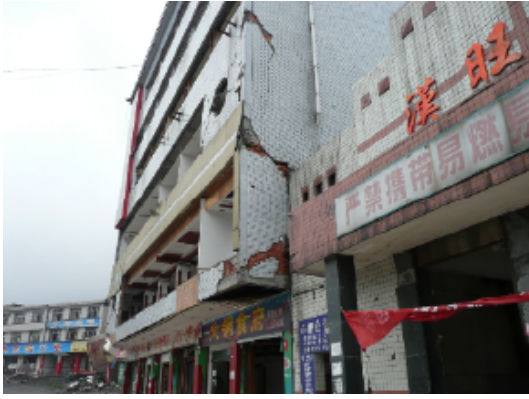
写真 4.2.3.17 (店舗兼住宅 7) 建物崩壊状況(1階と2階柱の不連続による破壊)