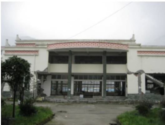
写真 4.2.1.2 漩口中学校内の校舎(1)