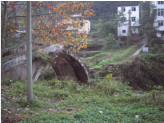
写真 4.2.4.7 崩落した敷地前の橋(2連 のアーチ橋であるが、奥のアーチが崩落 している。左手前が中学校である。)