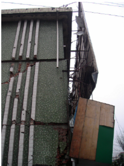
写真 4.2.3.15 (店舗兼住宅 6) 3階組積妻壁のせん断破壊