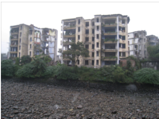
写真 4.2.2.15 共同住宅群（右側は損傷が少ないが、左側は部分崩壊となっている。）