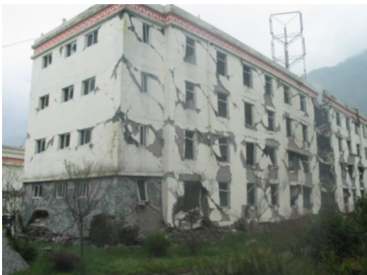
写真 4.2.1.7 漩口中学校内の学生寮