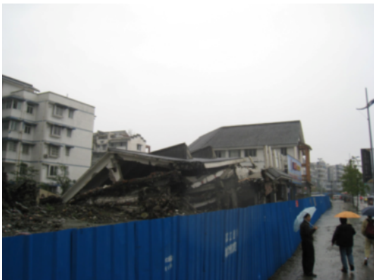
写真 4.2.2.5 倒壊した共同住宅

建設年代は 2000 年代とのこと。複数の棟で団地を形成している。倒壊した建物に隣接した同様の建物では、腰壁高さのブロックの存在により短柱化してせん断破壊した RC 柱 (写真 4.2.2.8)、ブロックの破壊が先行したことで長柱化して曲げ破壊にとどまった RC 柱 (写真 4.2.2.9) が混在していた。