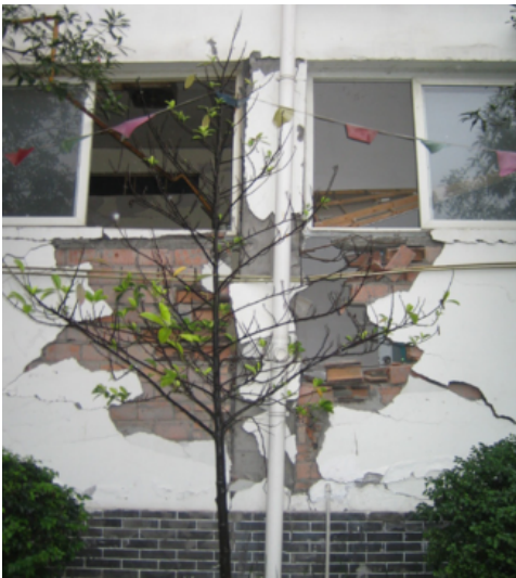
写真 4.2.2.9 長柱化した柱（腰壁（ブロック）の崩壊が先行したことで、RC 柱が長柱化したと推察される。）