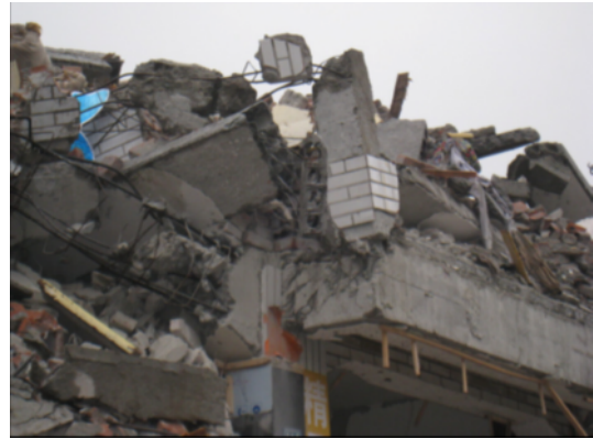
写真 4.2.2.14 写真 4.2.2.12 の張り出し部（写真 4.2.2.11、4.2.2.12 の比較と同様に、写真 4.2.2.13 より損傷が激しい。）