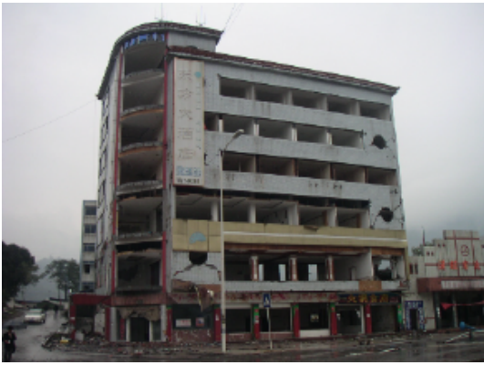
写真 4.2.3.3 (店舗兼住宅2) 1階柱曲げ破壊および2階以上の組積壁のせん断破壊