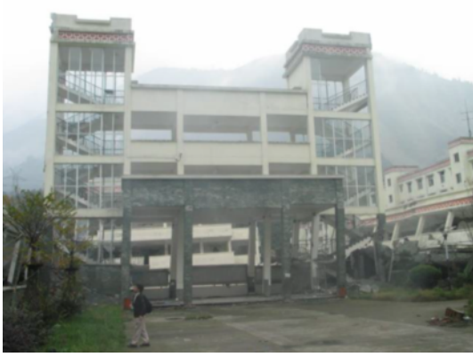
写真 4.2.1.9 漩口中学校内の廊下・階段室