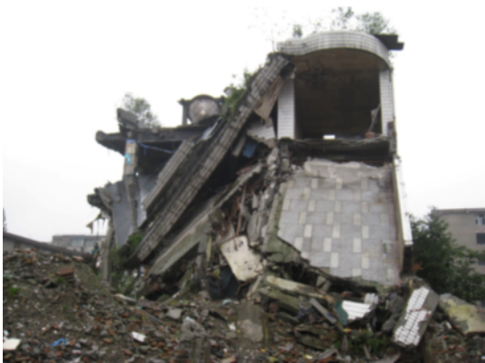
写真 4.2.2.1 入口の部分崩壊

建設は 80 年代後半とのこと。隣接する 2 階建ての建物 (同じくショッピングセンター) は倒壊し、調査時点では完全に解体されていた。