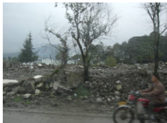
写真 4.2.4.10 倒壊した建物の跡(手前の 瓦礫は倒壊した建物の跡であると思わ れる。奥に仮設住宅が見える。)