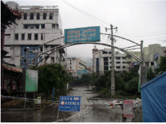
写真 4.2.3.21 継続的な立入禁止区域(1)