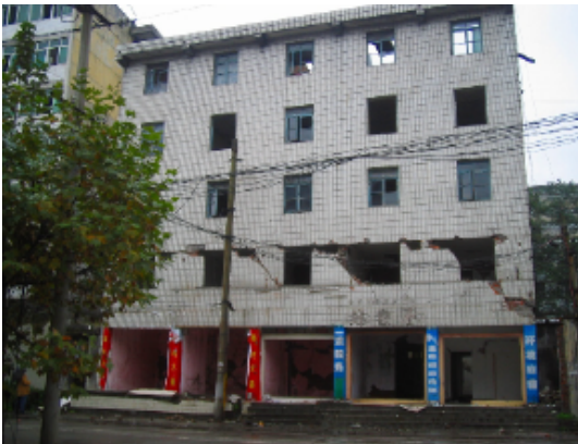
写真 4.2.3.9 (店舗兼住宅4) 1階柱曲げ破壊 + 1・2階組積壁せん断破壊