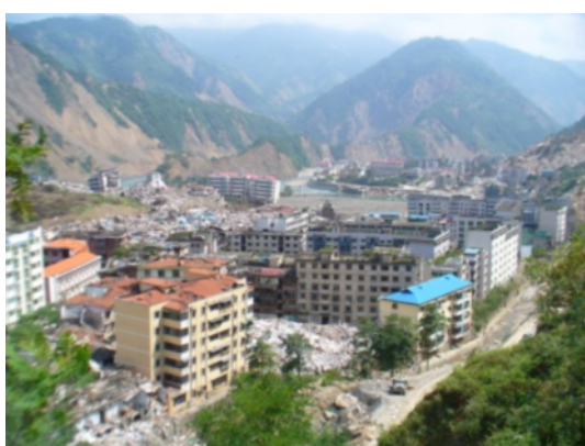
写真 4.2.5.3 曲山鎮の全景