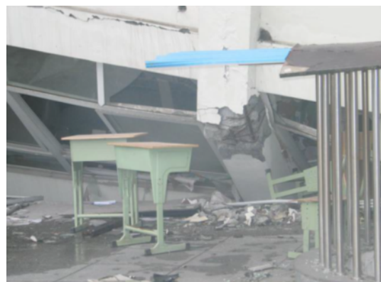
写真 4.2.1.5 写真 4.2.1.4 の建物の1階柱（柱頭の曲げ破壊が見られ、手前に大きく傾斜している。）