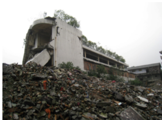
写真 4.2.2.2 写真 4.2.2.1 の側面 (手前は崩壊した 2 階建て建物からの救助作業に伴う解体とのこと。)