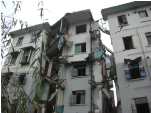
写真 4.2.3.25 立入禁止区域内住宅の部分的崩壊