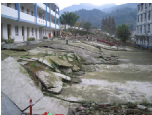
写真 4.2.4.1 敷地内の断層 (左右の建物は倒壊を免れているが奥の建物は倒壊している。)