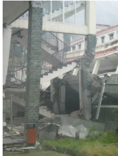
写真 4.2.1.10 写真 4.2.1.9 の 1 階柱(段床により短柱化した右側の柱が、柱脚で破壊した。)