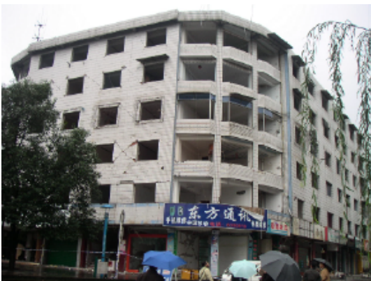
写真 4.2.3.5 (店舗兼住宅3) 1階柱の曲げ破壊 + 2階以上の部分的組積壁のせん断破壊