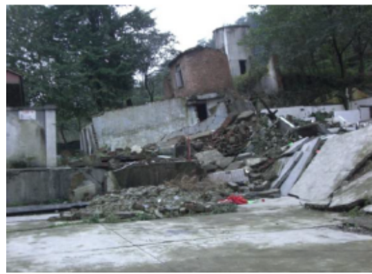
写真 4.2.4.8 敷地内の倒壊した建物(断 層直上にあり手前の建物は崩壊、奥の建 物は傾いている。)