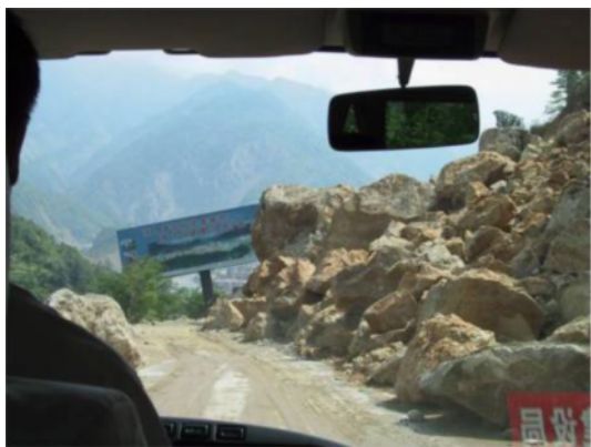
写真 4.2.5.1 落石による道路損傷 (北川県入口)

被害の概要は、写真の左側の山から崩落してきた土砂により、旧市街地のほとんどが埋められたこと、及びその他の周辺の山からの土砂崩落である。旧市街地には木造建築物が多く建築されていたらしいが、土砂によりほとんどを見ることはできない。その周辺には、鉄筋コンクリート枠組組積造と思われるホテル等が建築されているが、ほとんどの建築物に傾斜等による甚大な被害が生じていた。