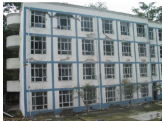
写真 4.2.4.4 写真 4.2.4.3 の奥のほう (4 階の方立て壁の上部がせん断破壊している)