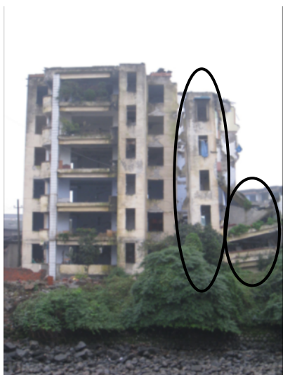
写真 4.2.2.17 部分崩壊した共同住宅（写真 4.2.2.15 の左奥に見える建物。建物右側の階段室と思われる部分は、左側に比べて1層分落下し、右側階段室奥の部分は完全に崩壊している）