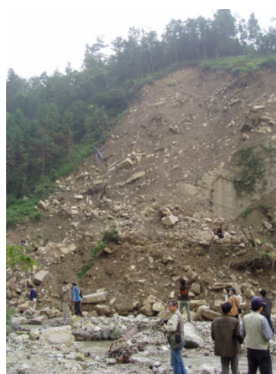
写真 4.2.7.1 地震により地表面に現れた断層(人のいる手前の崖が地震により生じた(以前は一帯が平坦))