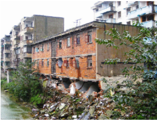
写真 4.2.3.19 (住宅 1) 3階建て組積造の破壊(1階が大きく破壊)