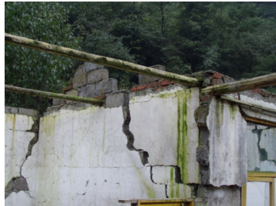
写真 4.2.7.4 コンクリートブロック造 (No5) ゲーブルの崩壊、屋根の落下、 壁のせん断破壊が見られる