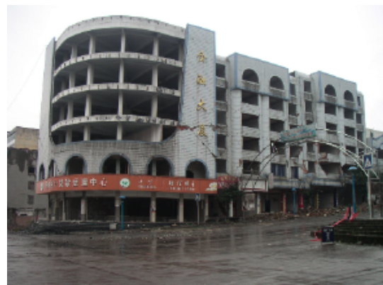
写真 4.2.3.6 (金融ビル) 1階柱曲げ破壊および2階以上組積壁のせん断破壊