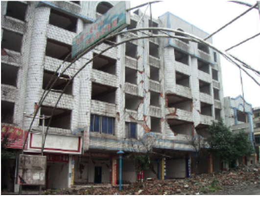
写真 4.2.3.7 (金融ビル) 2階以上の組積壁せん断破壊