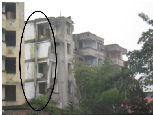
写真 4.2.2.16 部分崩壊した共同住宅(写真 4.2.2.15 の右奥に見える建物。外壁に見える白い壁は、部分崩壊により露出した内壁の一部と思われる。)