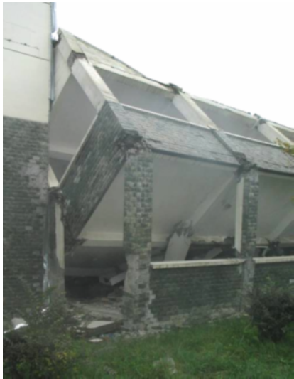
写真 4.2.1.6 写真 4.2.1.4 の建物の裏側 (裏側の 1 階柱も柱頭柱脚で曲げ破壊しているが、残留変位はさほど見られない。)