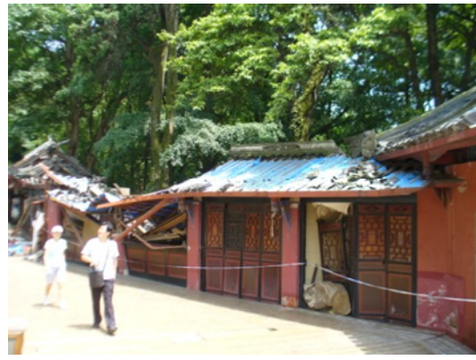
写真 4.2.2.19 歴史的建築物(落石により屋根が陥没している。)