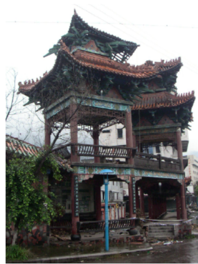
写真 4.2.3.20 (歴史的建造物) 上棟部分の崩壊

立入禁止区域(写真 4.2.3.21~26)周辺の建物被害については、近くで観察することはできなかったが、おそらく各階のレベルがずれていることから、1階が部分崩壊または層崩壊し、甚大な被害が発生したものと想像できる。なお、この付近では掘状の川が流れており、部分的に側方流動が生じたことにより被害が発生したという可能性も考えられる。