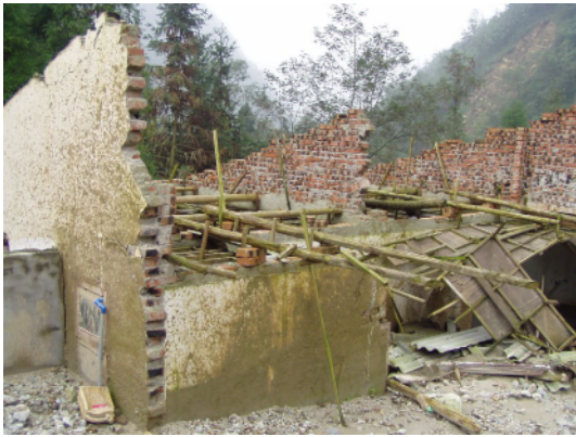
写真 4.2.7.1 レンガ造住宅 (No3) ゲーブルなどが崩壊し、屋根が落下して いる