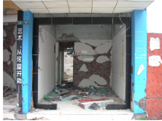
写真 4.2.3.2 (店舗兼住宅1) 1階内部の破壊状況