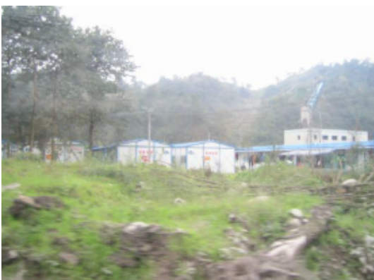
写真 4.2.4.9 仮設住宅(鎮内に数箇所、 仮設住宅が建てられている敷地があっ た。)