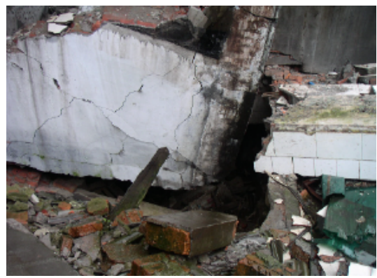
写真 4.2.3.14 (店舗兼住宅 5) 基礎部からの脱落