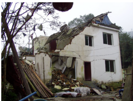
写真 4.2.7.7 地区でもっとも大きな住宅(No10)無補強レンガ造。PC パネルを受ける梁のみ RC 部材で、柱はない

一方、被害が比較的軽微な建物(No.1, No.2など。写真7.2.7.10)があり、その要因を明らかにできれば、今後の耐震性向上を考える際の貴重な知見となると思われる。今回は、限られた時間と実施体制の下の調査であり、これに取り組むことができなかったことは残念である。