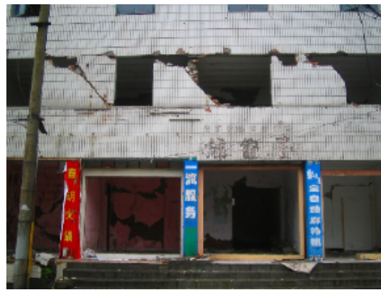
写真 4.2.3.10 (店舗兼住宅4) 破壊状況 (拡大)