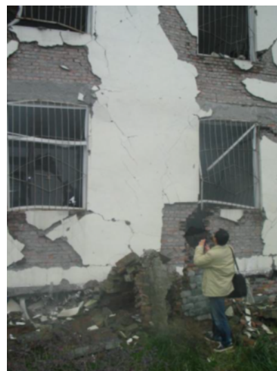
写真 4.2.1.8 写真 4.2.1.7 の建物の詳細 (白い壁部分の中央が RC 柱であるが、RC 柱および煉瓦のそで壁にもせん断ひび割れが見られた。)