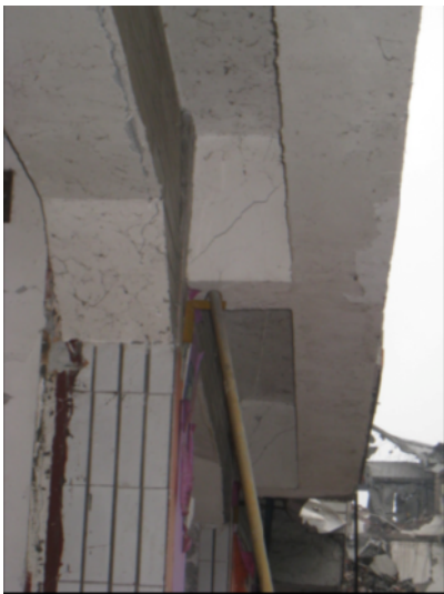
写真 4.2.2.13 写真 4.2.2.11 の張り出し部（1、2階の柱芯のずれのため、片持ち梁が、大きなせん断力を負担したものと思われる。）