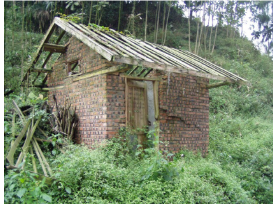
写真 4.2.7.2 レンガ造小規模建物 (No6) 壁の大きなせん断クラック、瓦の落下な どが見られるが、原型を留めている。