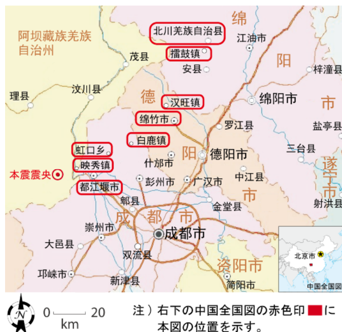
図 4.1.1 四川地震の震源及び現地調査地域 ( にて示す。4.2 参照 )