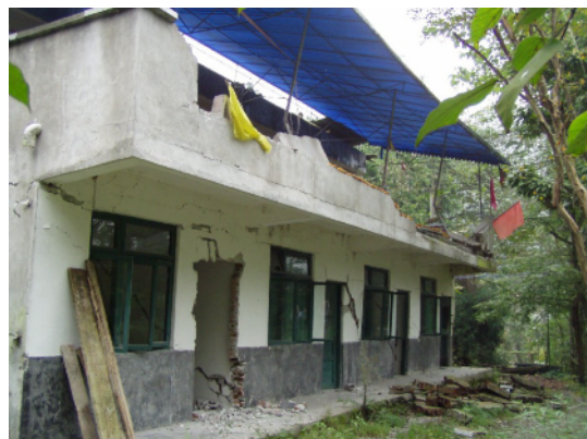
写真 4.2.7.6 レンガ造の建物 (No9) 2 階 パラペットが落下。1 階の壁にも重大な せん断クラックを生じている