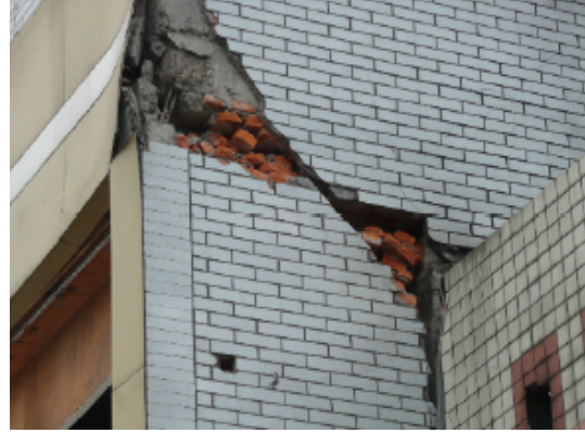
写真 4.2.3.18 (店舗兼住宅 7) 2階組積妻壁の破壊