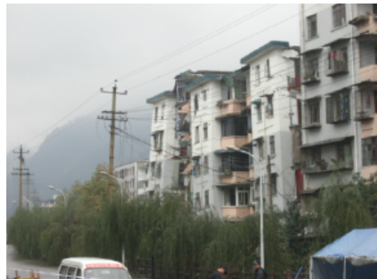
写真 4.2.3.24 立入禁止区域内の被災住宅全景