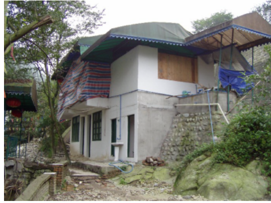
写真 4.2.7.9 組積造の典型的な倒壊パターンの一つであるケーブル崩壊による屋根の落下 (No7) 写真 4.2.7.10 2階建てで被害が軽微な住宅 (No1)