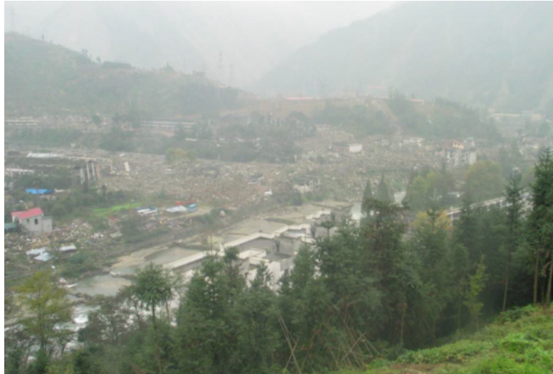
写真 4.2.1.1 映秀の遠景