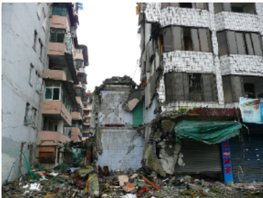
写真 4.2.3.23 (店舗兼住宅 8) 部分的崩壊