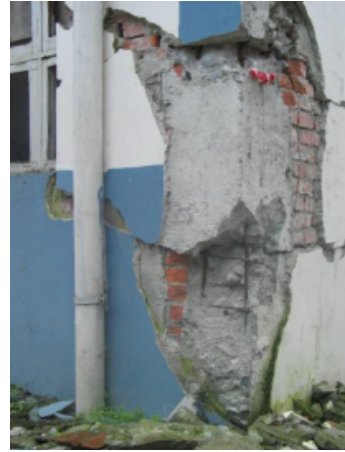
写真 4.2.4.6 写真 4.2.4.3 の手前の柱脚 (RC 柱が激しく損傷している。)