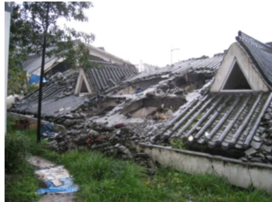
写真 4.2.2.6 写真 4.2.2.5 の裏側 (解体跡、救助作業に伴うものと思われる。)