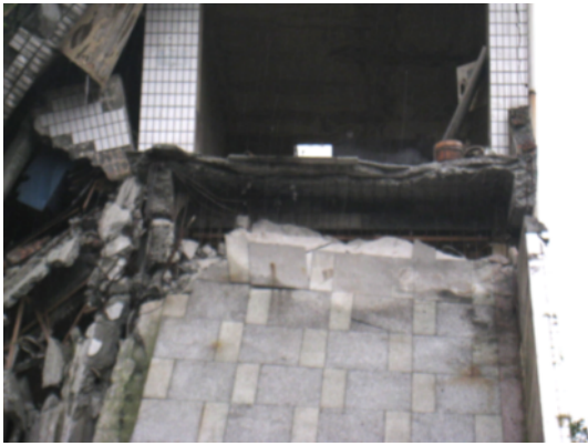
写真 4.2.2.3 写真 4.2.2.1 の 2 階床部分 (床版下面のコンクリート剥落により、露出したメッシュ筋が確認できる。)