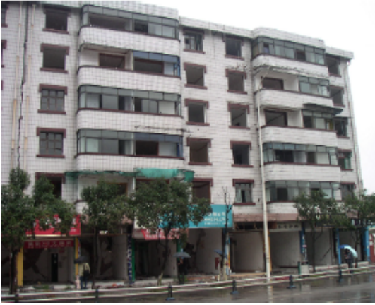
写真 4.2.3.1 (店舗兼住宅1) 1階柱の曲げ破壊 + 組積壁のせん断破壊