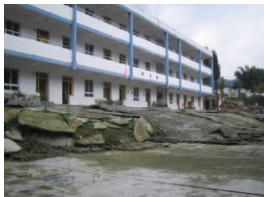
写真 4.2.4.2 断層の上側の建物 (この建物の被害は軽微である。手前の地盤と建物の地盤は地震前には同一の高さ。)