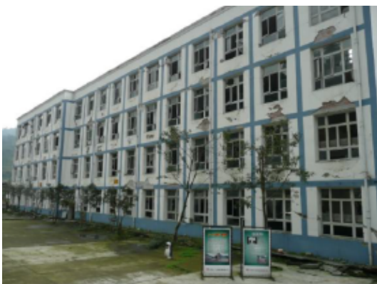
写真 4.2.4.3 断層の下側の建物 (腰壁、方立て壁はほとんど大きく損傷している。特に奥のほうの 4 階の方立て壁の損傷は激しい。)