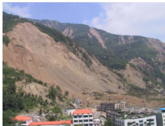
写真 4.2.5.2 大規模な土砂崩落 (北川羌族自治州曲山鎮)