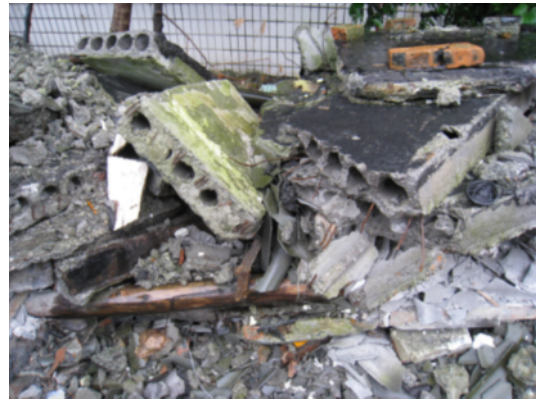
写真 4.2.2.4 解体跡に残る中空 PCa (一般的に床版に用いられている中空 PCa 床版。中国国内の各所で同様の PCa が使われている。)