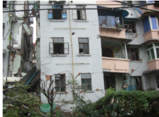
写真 4.2.3.26 立入禁止区域内住宅の被害状況