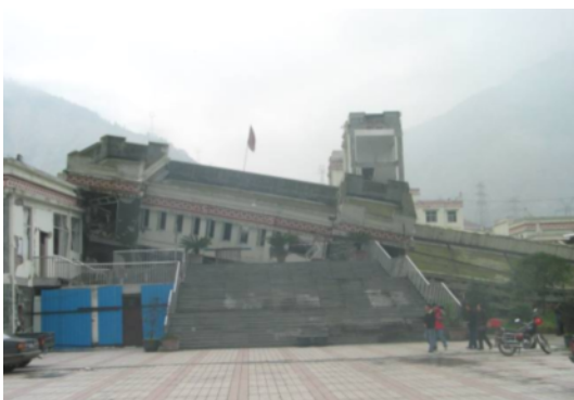
写真 4.2.1.4 漩口中学校内の校舎(2)