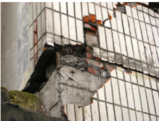
写真 4.2.3.11 (店舗兼住宅4) 破壊状況 (拡大) 2階隅柱の破壊状況