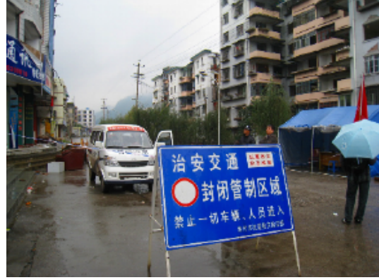
写真 4.2.3.22 継続的な立入禁止区域(2)