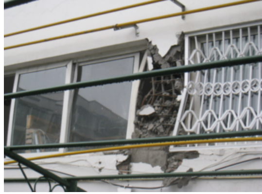
写真 4.2.2.8 短柱のせん断破壊（ブロックの腰壁が剛強で短柱化したと思われる。）