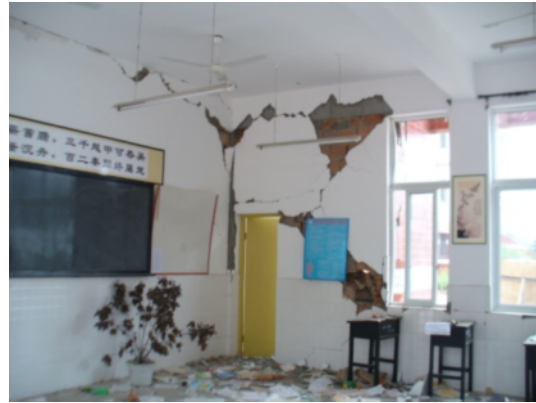
写真 4.2.6.1 天井脱落等の学校建築