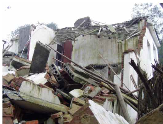
写真 4.2.7.8 同左。床に PC パネルを使用していたことが分かる