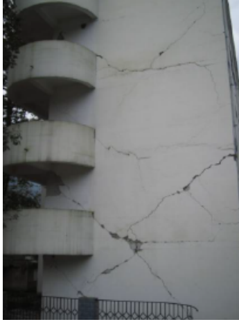
写真 4.2.4.5 写真 4.2.4.4 の左の妻面 (妻面の壁は大きく損傷している。)